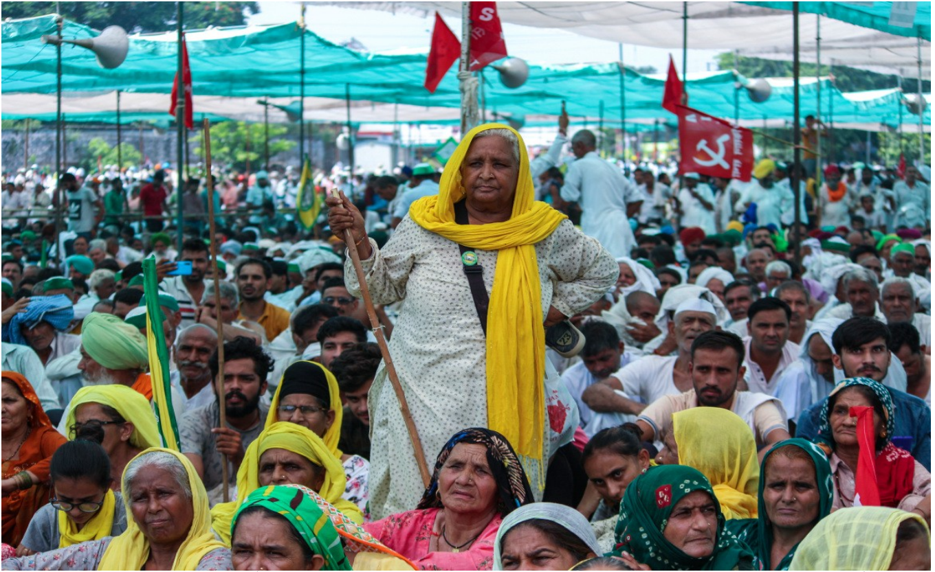
شالوی کۆفید، دەست بەسەری و کوتان و برسی کردن... هەمووی لە یەک دەسەلاتەوه هاتۆتە خوارەو بۆ لە ناو بردنی ئیمەیی چەوساوه کانه. پەسواي ئەکەیین و بەرپەرچی ئەدەینەوه ...