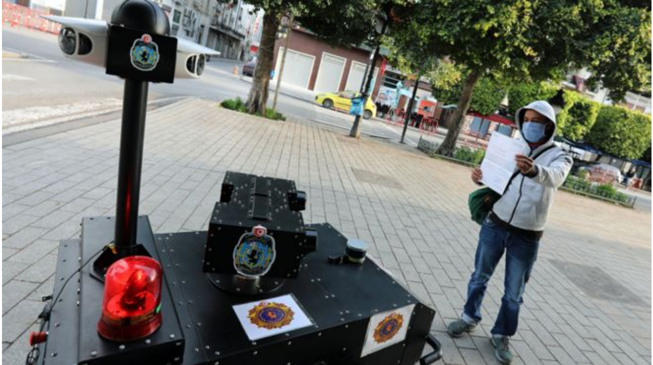
BBC 03/04 Tunisia deploys police robot on lockdown patrol ..The robot questions people it sees out on the streets