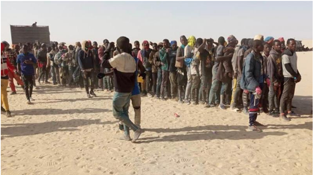
Madama, a military outpost close to the border between Niger and Libya

مه به ست يان ئامانجى نه م هيرشه جيهانيه به رگرتن نى يه به په تا ، چوونكه هيج په تا يه ك له نارادا نى يه . بهلكو نه وه به كه قوول ترين و چنراو ترين زوردای و زولمى به ها ( ڤاليو) بسه پيښت دژ به ژيانى مروڤ، هه موو په يوه نديه كانى مروڤ بابه ده ست دارايى يه وه ( financial )، ديكتاتوريه تى ويښه يى پاره ( VIRTUAL money ) بسه پيښت به سهر هه موو لايه نه كانى كؤمه ل دا و زوردارى و نيره كهرى پاره دارى ئورستؤكراتى بسه پيښت به سهر هه موو بواره كانى ژياندا. مه به سته كه نه وه به، به تپهه لكپش له گه ل گه وره ترين شانؤگه رى زيندوو له ميژوودا، كه په يوه نديه كانى مروڤ به شيوه يه كى گشتى ريسيت ( ته رتيب ) كه نه وه، بؤ نه ويه كه هه موو مروڤايه تى ده سته مؤ بكن، بؤ نه ويه كه به بانكايه تى كردن ده ست به سهر هه موو بواره كانى په يوه نديه كانى " مروڤ " دا بگريت و به زور پاره بكنه نامراز يان ناوه ندى هه موو شتيك. دوپا تكرنه وه و گشتى كردنه وه ي سه ركو تكدن له سه ر ئاستى گپتى به شيكى سه ره كين له م راهي نانه ي ده سه لاتداريه تى، نه مه ش بؤ نه وه ي نه و فه رمانره وايه نوپيه ي جيهان بسه پيښن كه ئوريس تؤكراته كان نه يانه وي ت .