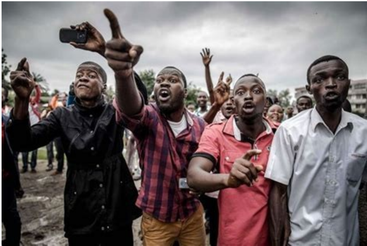
پروڤلتارياكان لە كۆنگۆي رۆژھەلات دژ بە

پروڤلتاريا دەمپكە ھۆشيارە بە رۆي نەتەوہيە كگرتووەكان لە دروستكردنەوہي پايەكانى سەرمايەدارى و ليدان لە ھەستانەكانى پروڤلتاريا. چەككردنى پروڤلتاريا و چەكداركردنى بۆرجوازىيەت . لە جيبەجيبكردنى پرۆژە ئابوورى و سياسى و تەندروستىيەكانى كۆمپانيا نيو دەولەتپەكاندا... كرددەوہكانى ريكخراوى نەتەوہيە كگرتووەكان لە 1991- 2000 لە كوردستان برىتى بوو لە : ھينانى ريكخراوہ خيڤرخوازيە ئاينى يەكان، كرددنەوہ و ئاوەدان كرددنەوہي مزگەوت و پەرستگاكان، ئابلوقەو چەككردنى پروڤلتاريا، ھيڤزى ئابوورى و مالى و خۆراكى خستنە دەست ھيڤزە ناسيوناليسىت و ئايينپەكانەوہ، بۆ زال بوونيان بەسەر پروڤلتاريا، تەنسيقكردن و تەقويەكرد نەوہي ياسا و دەستور، ريكخستنى گفتوگۆي ھيڤزەبوارجوازىيەكان، پيكھينانەوہي دەولەت، ... لە رابردووى يوگۆسلاقيادا و لە ولاتەكانى ئەفەريقيادا لەوہش زياتر رۇڤيان ھەبوو لە جينۆسايدى راستەوخۆي دانىشتواندا.. لە ھۆشيارى پروڤلتاريا بەم رۆلە دژە شۆرشگيرەي ريكخراوہكانى نەتەوہيە كگرتووەكان لە كۆتايى 2019 دا، دوای بيست سال لە بوونى ھيڤزەكانى ئاشتى خوازي نەتەوہيە كگرتووەكان لە كۆمارى رۆژھەلاتى كۆنگۆدا، پروڤلتارياكانى ناوچەكە بە ليشاو ھەليان كوتايە سەر سەربازگا و بنكەكانى ئەم ھيڤزانە و ئاگرىان تى بەرداو ويرانيان كرد. بە شيوەيەكى بى ئەم لاو ئەولا و بە تووند و تيزى ئەم ھيڤزانە يان، كە بە ھيڤزىيە ھيڤزى ريكخراوى نەتەوہيە كگرتووەكانە لە جياھاندا ( 1)، بە جينۆسايدكەر و ھاندەرى ويرانى و تيرور لە ناوچەكەدا دەست نيشان كرد.