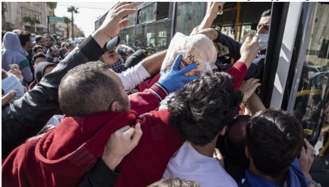
People crowded around buses distributing bread in some areas of Amman on Tuesday ( Jordan )

گرنگترین شت ئەمرۆ بۆ مەرفەکان ئەوەیە کە ئەو درۆیە قبوول نەکەن ک گواپە ئەم دابەزینە درندانەییە چالاکیه کان بۆی هەیه بەهۆی شتیکی نەگبەتی وەک ڤایرۆس، پاندامیک، ئاژاوە... وە بیت، کە پێویستە بە "هەموومان چارەسەری بکەین"، وە ئەوە راگەیهنن کە ئەو سەپاندنە لە دابەزینی چالاکیه کان و زیادکردنی برسیتی و لە نێر و مێ خستی ژبان، ئەمانە بەشیکن لە پریاریکی بەمەبەستی حکومەتە جیهانیە کە. بۆ یە ئەوە بە پێکەوت نی یە کە هەرە دەست پۆشتووکانی تیمی بیلدیبرگ (the Bilderberg) خۆیان راستەوخۆ هەلئەسن بە تەدەخولکردن، کاتیک کە ئیحتمالی ئەوە سەر هەل ئەدات کە پلانە کە لە شوپێنیکدا بەباشی دەوری تیکشکینەرانی خۆی نە بینو، پراوو و پووت و چەتەیی ئابووری باش نەکردوو. کاتیک کە سەرکۆماری ئەرجینتینا، فیرناندیز، خەریکی ئامادەکردنی پلانی وورده ووردە کردنەوێ چالاکیه ئابووریە کان بوو) لە دەورووبەری 15ی ئەپرلی 2020 دا) وە مفاووزات و دانیشتنی لەسەر ئەکرد لە گەل پێکخراوەکاندا بۆ جیبه جی کردنی، سۆرۆس (Soros) تەلەفوننی بۆکرد و سوور بوو لەسەر ئەوەی کە ئەبیت بەردەوام بیت لەسەر پلانی دەستبەسەری کردنەکە و داخستن و مەنعتە جەولە کە: ئەمە ئەوە نیشان ئەدات کە دیارە ئەو تیکشکاندەنی کە تا ئیستا کراوە بەس نی یە. برسیتی لە عەمان / ئوردون