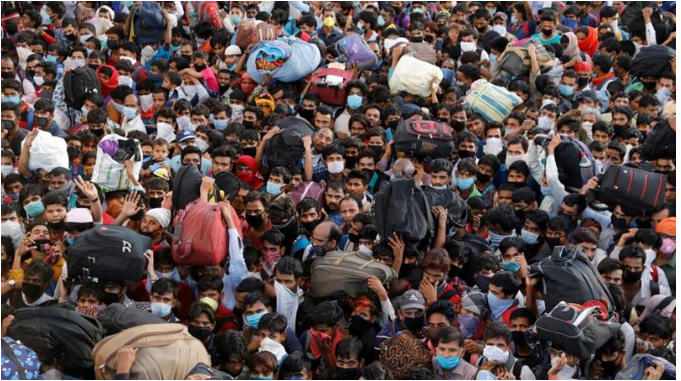
Migrant workers crowd together outside a bus station as they wait to board buses to return to their villages on the outskirts of New Delhi

هه موو ئەمانهى سهر وههش زىادكردنى به ها و دهوله مهندى و فهрман ره وايىي پاره يه به سهر ژياندا