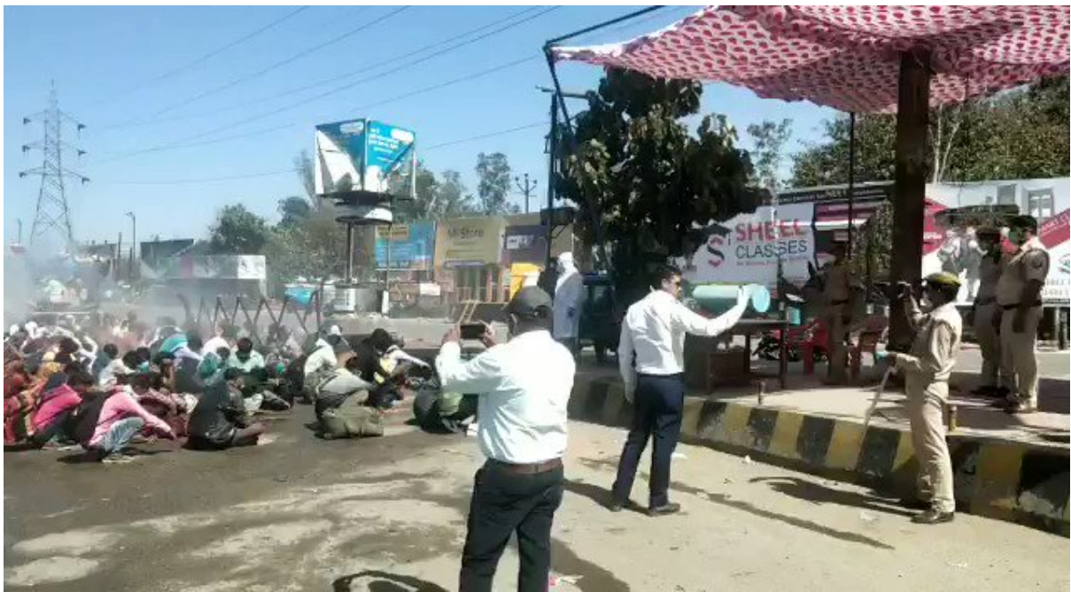
sprayed with disinfectant in India

ئوهى كه زۆر جيبى دل ته نكيه ئه وه يه كه سه رمايه بارودوخه بۆگه نه كان، به تۆقاندنى ڦايرۆسه كه شه وه، ئه سه پينيت له شاره كاندا، له لادى كاندا، له و ناوچانه دا كه به چرى پرۆليتاريايى تيايه، له ئۆردوگا كاندا، له نه خو شخانه كاندا، له زيندانه كاندا، له نه خو شخانه دهرونه كاندا، له كه مپه كاندا... و ته نانه ت له و ماله نشدا كه ساغ و ناساغ تر شينراون به سه ر يه كدا! ئوهى كه درۆيه مه سه لهى ڦايرۆسه، ئه وه يه كه له به كتر به وه ئه يگر بين، ژماره و هيلكيشه كانى ريكخراوى ته ندروستى جيهان (WHO) يه، په تا بلاو بوونه وه يه. ئه وهى كه راسته، هه ر له سه ره تا وه، سيناريو هه زه له / تاله دل ته زينه كه يه، ئه و شالاو و ئابلوقه دانه راسته قينه يه يه كه برسيتى خولقاندوو و ساده تر بين پيداويستى نه هيشتنوو. راسته يه كهى ئه وه يه كه ئيفليج بوونى به ره مه پينانى جيهانى له پشتى په رده وه (in the shadows) پريارى له سه ر دراوه، له لايه ن ئۆرؤستؤكراته پاره داره كانى جيهان (the world financial aristocracy)، كه گسك دانه له دانيشتوانى گيتى. له پي هه له به ستن وشالاوگه رى درؤ زه به لاحه كه يانه وه، هانى قه سا بخانه يه كى جيهانى راسته قينه ئه دهن و ئه يانه وپت كه ئه و فه رمانزه واييه جيهانى يه نوئ يه به سه پينن، كه فه رمانزه وايان چهنده وه خته چهنه ي له سه ر ئه دهن.