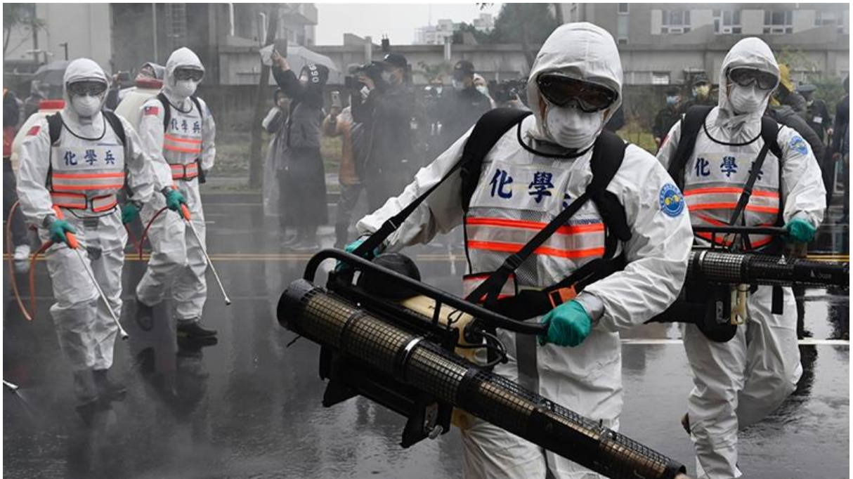
Soldiers work to... in Taipei's Xindian district

A total of 81% of the global workforce of 3.3 billion people have had their workplace fully or partly closed. "Workers and businesses are facing catastrophe, in both developed and developing economies," said ILO director general Guy Ryder.