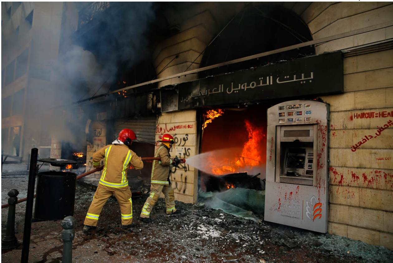
a Credit Bank, set on fire by anti-government protesters in Tripoli 29/04/20 Lebanon

ئامپىرە دېجىتەلپەكان و كارتهكانى شاياندارو شانازيان ھەلگىروو ھەلگىروو ھەلگىروو بۇ ئىخبارى كىردن و... ئابلوقە و دەستبەسەرى، ھەستى بى دەسەلاتى بەرامبەرى، چەواسندنەو ھەكەى، داپلوسىنەكەى، جىكارى و جىاكىردنەو ھەكەى، لە نپرو مى خستەكەى... ھەمووى تىكدان و تىكشكاندى ئەو ھەكە بەراستى زەرورپە بۇ ژيانى مرؤف خەباتى پرؤلىتارىا لە لوېنان