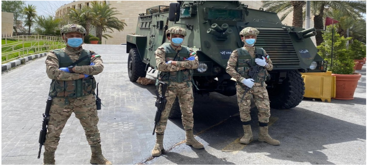
Jordanian troops have been posted in Amman to enforce the government-imposed curfew