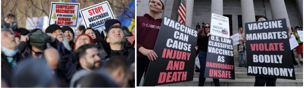
كوفيد 19 هو كذب ، اللقاح هى اعتداء الطبى ظالم ، وهو ضد استقلالية اجسادنا....

وفات اللذين يموتون من وراء لقاح .بان كوفيد هو سبب الموت لا غير! وليس من حق اى شخص ان يستفسر عن هذه الجريمة ولا عن تركيبة و مكونات اللقاح... وفى بحث منشور فى 2020 79% من هؤلاء الذين توفوا بسبب كوفيد 19 هم الذين مطعمون بالكامل(تلقوا جميع اللقاحات الاخرى) قبل اصابتهم بكوفيد .... لذلك يجب ان نقف ضد هذا المشروع وهذا البرنامج للسلطة و نفضحه بالكامل ونتحداه بدون تردد