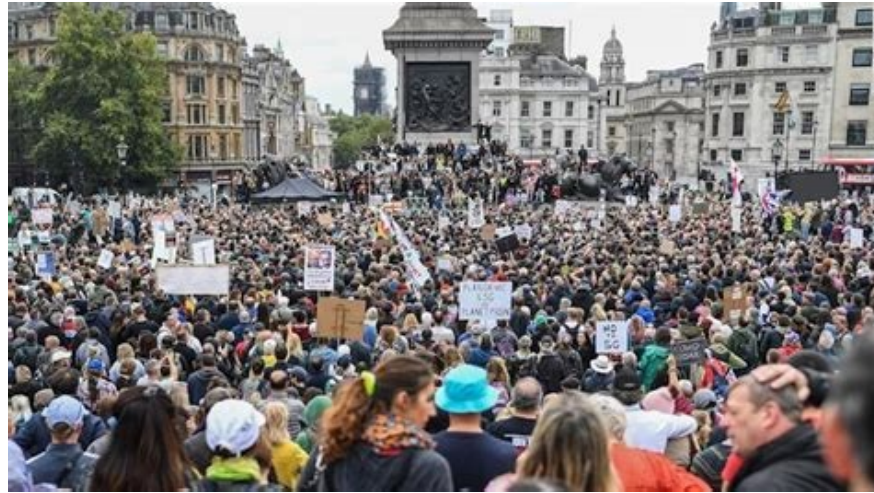
البروليتاريون فى برلين ، يتصدون للسلطة بوعى ضد ظلم التطعيم الالزامى وفرض كذبة كوفيد

(ليس فقط اختراع كوفيد ،بل عشرات الاكاذيب الاخرى فى الطريق . امراض مميتة اخرى ،للترهيب والاستسلام : فطر الاسود ،المتحورالجديد من كوفيد ، صارت العلوم الطبيية احسن سلاح بيد السلطة للتريعيب والاخضاع!!) يحاصر ويعزل ويستعبد المضطهدين ،ويجعلهم رهائن عن طريق منع تجوال والقانون والعقوبة ، ثم عن طريق سلسلة من اللقاحات وتدخلات الطبية العسكرية يدمر حياتهم ، ويحرمهم من الانسانية ، هذه هي حقيقة وهدف هذه الدكتاتورىة ، تصدوا لها و ابصقوا فيها