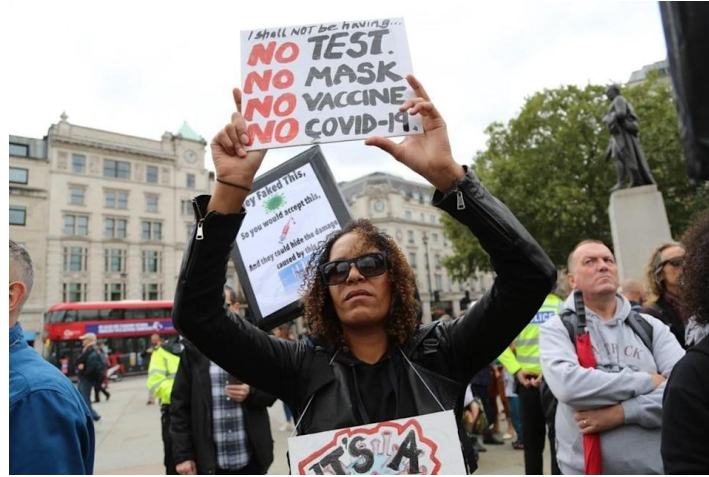
لا للفحص، لا للكمامة ، لا للتطعيم .لا للكوفيد 19 . كوفيد هو كذب واحتيال